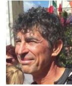
Alain Rasplus Conseil Gestion Informatique