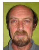
Marcel Manson Animation site internet