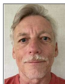
Eric Bonnet Conseil en communication Responsable Section Trail