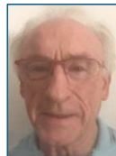
Christian Dupoux Relations FFA / Ligue